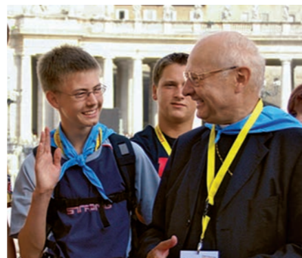
Erzbischof Dr. Zollitsch trifft junge Messdiener in Rom.

Erzbischof Dr. Robert Zollitsch zieht eine positive Bilanz all dieser Aktivitäten: „Die Gläubigen in unserer Erzdiözese zeigen mit jeder Spende, mit jedem Engagement, mit jedem Gebet und jeder interessierten Nachfrage, dass Ihnen die Kirche und ihre Werte am Herzen liegen. Sie alle wollen mithelfen, dass wir und unsere Kinder und Enkel auch in Zukunft aus ihnen für unseren Alltag Kraft schöpfen können. Und darum werde ich die Initiative weiter vorantreiben.“